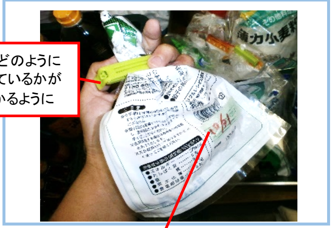
③開封済み食材の保管の様子が分かる写真