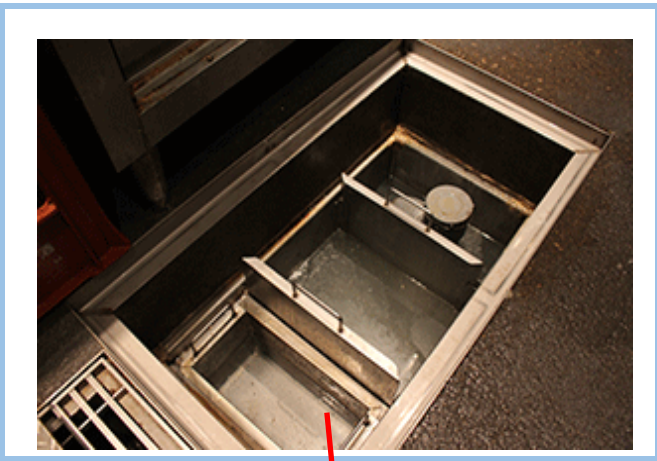
⑩グリストラップの蓋を開けた状態の写真

デジタルでも、アナログでも可表示や目盛が読めるように設置がなければ「設置なし」と入力