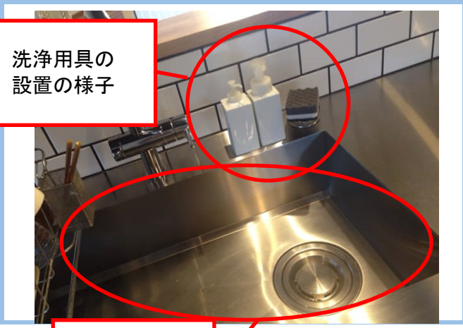
⑤洗浄用具を含むシンクの様子が分かる写真