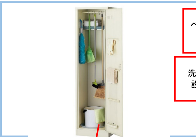
⑪清掃用具を保管しているところの様子が分かる写真