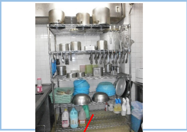
④調理器具(ボウル等)の保管の様子が分かる写真