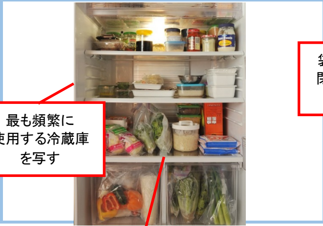
②冷蔵庫内全体が見える写真