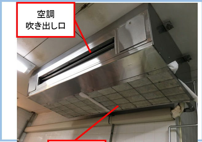
⑧空調吹き出し口、あればフィルターの様子が分かる写真