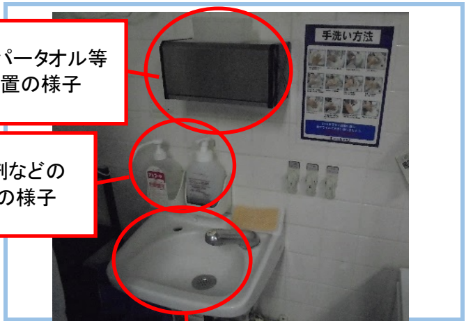
⑫ハンドシンク全体の様子が分かる写真