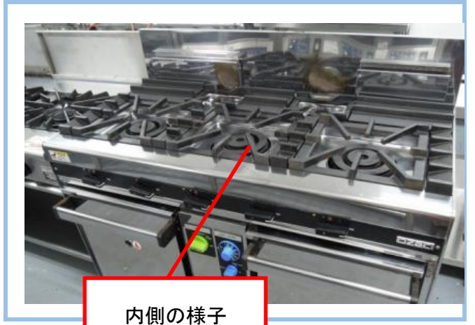
⑥ガスレンジ全体の様子が分かる写真