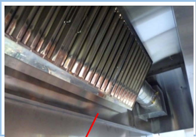
⑦ダクト・フード・フィルター等の換気設備全体の様子が分かる写真